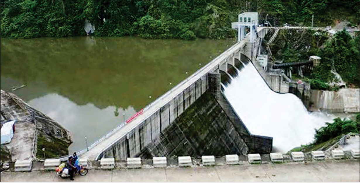
ကချင်ပြည်နယ်ရှိ တပ်ဆင်အင်အား ၉၉ မဂ္ဂိလပ်ရှိသောချီဇွေငယ်ရေအားလျှပ်စစ်စက်ရုံ

၁၉၉၆ ခုနှစ်တွင် ပြည်နယ်ဝန်ကြီးချုပ်များ တွေ့ဆုံပွဲ (Chief Ministers Conference 1966 ) တွင် လျှပ်စစ်ပြဿနာများကို ဖြေရှင်းရန် လွတ်လပ်သော လျှပ်စစ်လုပ်ငန်းကော်မရှင် (Independent Electricity Regulatory Commission ) ဖွဲ့စည်းရန် လိုအပ်ကြောင်း ဆုံးဖြတ်ချက်ချမှတ်ခဲ့ကြသဖြင့် ၁၉၉၈ ခုနှစ်တွင် (Central Electricity Regulatory Commission CERC) ဖွဲ့စည်းခွင့်ကို လွှတ်တော်မှဥပဒေချမှတ်ခဲ့ပြီးနောက် နှစ်နှစ်ခန့်အကြာတွင် ပြည်နယ်