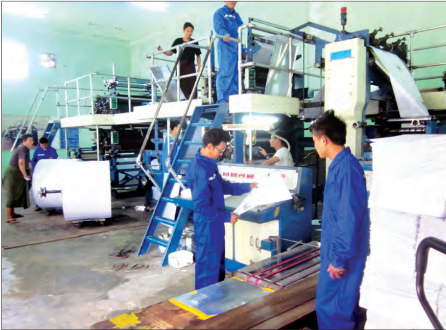
ပုံနှိပ်ရေးနှင့် ထုတ်ဝေရေးဦးစီးဌာနအောက်ရှိ နေပြည်တော် ပုံနှိပ်စက်ရုံ၌ ပုံနှိပ်လုပ်ငန်းများ ဆောင်ရွက်နေစဉ်