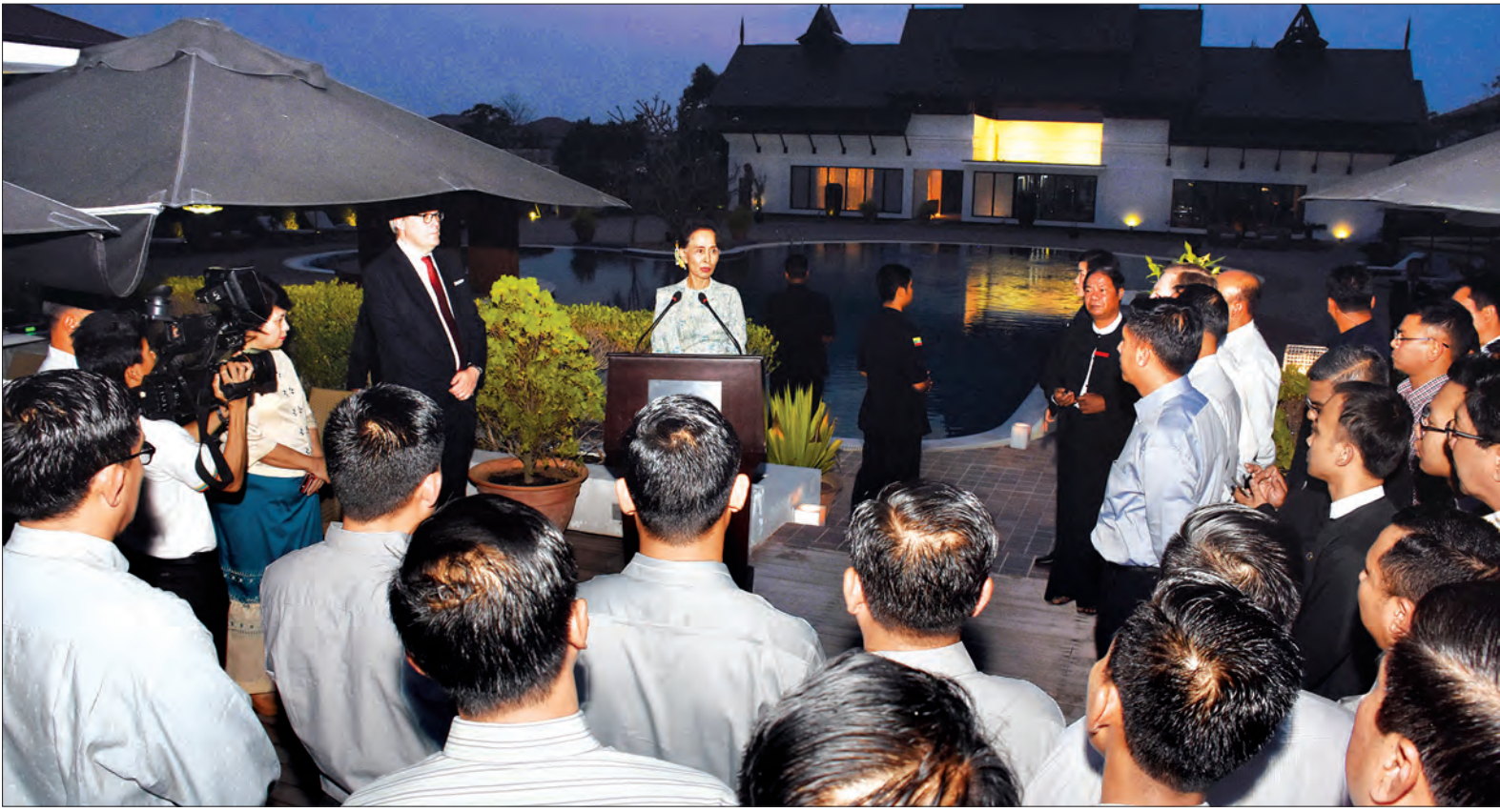
နိုင်ငံတော်၏အတိုင်ပင်ခံပုဂ္ဂိုလ် ဒေါ်အောင်ဆန်းစုကြည် ကာကွယ်ရေးကိုယ်တော်စစ်ရေးအဖွဲ့အစည်းအဖွဲ့ဝင်များနှင့် သင်တန်း နည်းပြများနှင့် သင်တန်းသားများ၏ ညစာစားပွဲအခမ်းအနား တွင် အမှာစကားပြောကြားစဉ်

ထိုနေ့က နိုင်ငံတော်၏ အတိုင်ပင်ခံ ပုဂ္ဂိုလ်က သင်တန်းနည်းပြများနှင့် သင်တန်းသားများအား နှုတ်ခွန်းဆက် အမှာစကားပြောကြားရာတွင် ယခု သင်တန်းတွင် တပ်မတော်၊ မြန်မာနိုင်ငံ ရဲတပ်ဖွဲ့နှင့် အုပ်ချုပ်ရေးဘက်မှ သင်တန်း သားများပါဝင် တက်ရောက်နေပါ ကြောင်း၊ မိမိနိုင်ငံတော်၏ ယခုကဲ့သို့ ကဏ္ဍအသီးသီးက ပူးပေါင်းဆောင်ရွက် ပြီး တစ်ဦးနှင့်တစ်ဦး နားလည်မှုရှိအောင် ဆောင်ရွက်ခြင်းသည် အရေးကြီးပါ ကြောင်း၊ သင်တန်းဆရာများ၏ သင်ပြ သော သင်ခန်းစာများအပြင် တစ်ဦးနှင့် တစ်ဦး ဆက်ဆံရေး၊ မတူညီသည့်စနစ် များအကြားတွင် မည်သို့ပြေပြစ်အောင် ဆက်ဆံရမည်ဆိုသည့် အကျိုးများကို လည်း ရရှိမည်ဟု မျှော်လင့်ပါကြောင်း၊ ယခုကဲ့သို့ သင်တန်းများတက်ခြင်းအား ဖြင့် မိမိတို့နိုင်ငံအတွင်းသာမက ကမ္ဘာ့ အလယ်တွင် မိမိတို့၏ သင်တန်းသားများ သည် တင့်တင့်တယ်တယ် နိုင်ငံတော်အဖွဲ့ များကို ထမ်းဆောင်နိုင်မည်ဟု ယုံကြည် ပါကြောင်း ပြောကြားသည်။