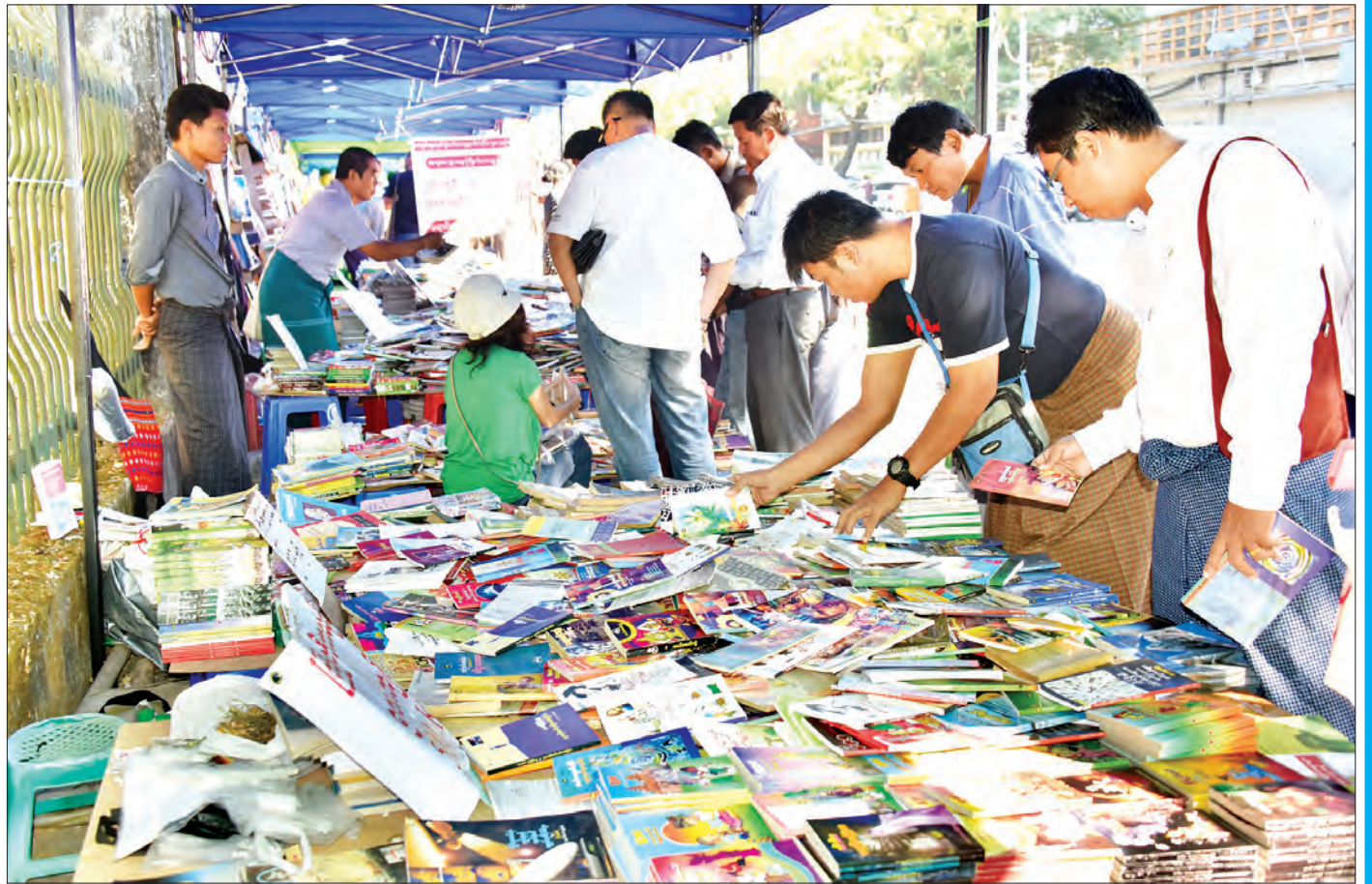
ရန်ကုန်မြို့၊ သိမ်ဖြူလမ်းရှိ စာအုပ်ဈေးရောင်းပွဲတော်အတွင်း စာပေဝါသနာအိုးများ စာအုပ်များကို စိတ်ဝင်တစား ရွေးချယ်နေကြစဉ်