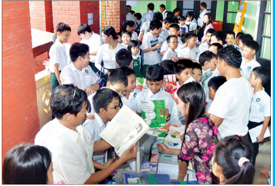
ရန်ကုန်မြို့၊ ဗဟိုပုံနှိပ်စက်ရုံဝင်းအတွင်း စာအုပ်ဈေးရောင်းပွဲ၌ ကြိုက်နှစ်သက်ရာစာအုပ်များ ရွေးချယ်ဝယ်ယူနေစဉ်

ပေးအပ်နိုင်ရေးအတွက် ကြိုးစားဆောင်ရွက်လျက်ရှိခြင်းဖြင့် ဝန်ကြီးဌာန၏ခက်မကြီးတစ်ခုအဖြစ် နိုင်ငံအတွက် အကျိုးပြုနိုင်ငံတော်အစိုးရသစ်၏ တစ်နှစ်တာအတွင်း ပြန်ကြားရေး နေပါကြောင်း။