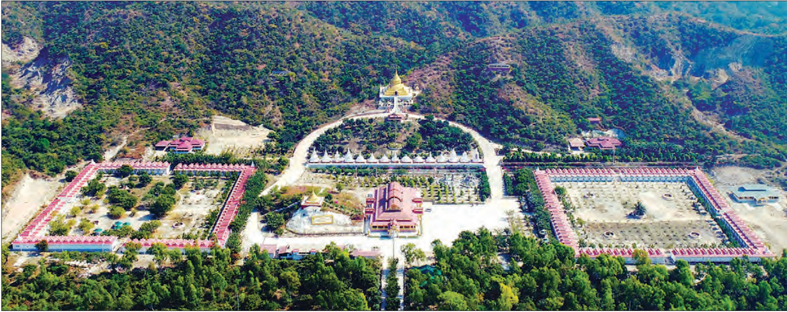
သီတဂူဆရာတော် တည်ထောင်သော သီတဂူအပြည်ပြည်ဆိုင်ရာ ဝိပဿနာအကယ်ဒမီ