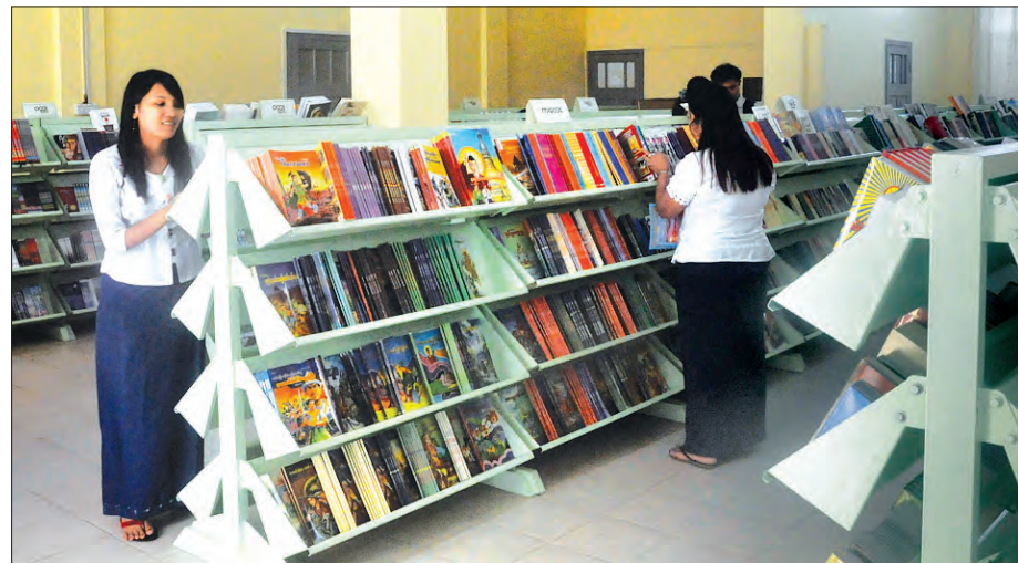
ရန်ကုန်မြို့၊ စာပေဗိမာန်စာအုပ်အရောင်းဆိုင်၌ စာအုပ်များ ပြသထားမှုကို တွေ့ရစဉ်

စာပေဖွံ့ဖြိုးရေးနှင့် သုတ၊ ရသစာပေများကို ပိုမိုဖြန့်ဖြူးပေးနိုင်ရေးနှင့် ပုံနှိပ်စာပေထုတ်လုပ်ဖြန့်ချိမှုလုပ်ငန်းများ တိုးတက်လာစေရန်အတွက် စာပေဗိမာန်စာအုပ်ဆိုင်သစ်ကိုလည်း ရန်ကုန်မြို့၊ စာပေဗိမာန်အဆောက်အအုံတွင် ထပ်မံတိုးချဲ့ဖွင့်လှစ်ခဲ့