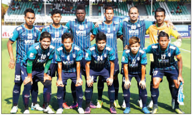
ထိပ်ဆုံးမှ ဦးဆောင်နေသည့် ရန်ကုန်အသင်း

MNL အမှတ်ပေးပြိုင်ပွဲ ပွဲစဉ်(၉) ယနေ့ စတင်ကျင်းပမည် သတင်း၊ စာမျက်နှာ ၅