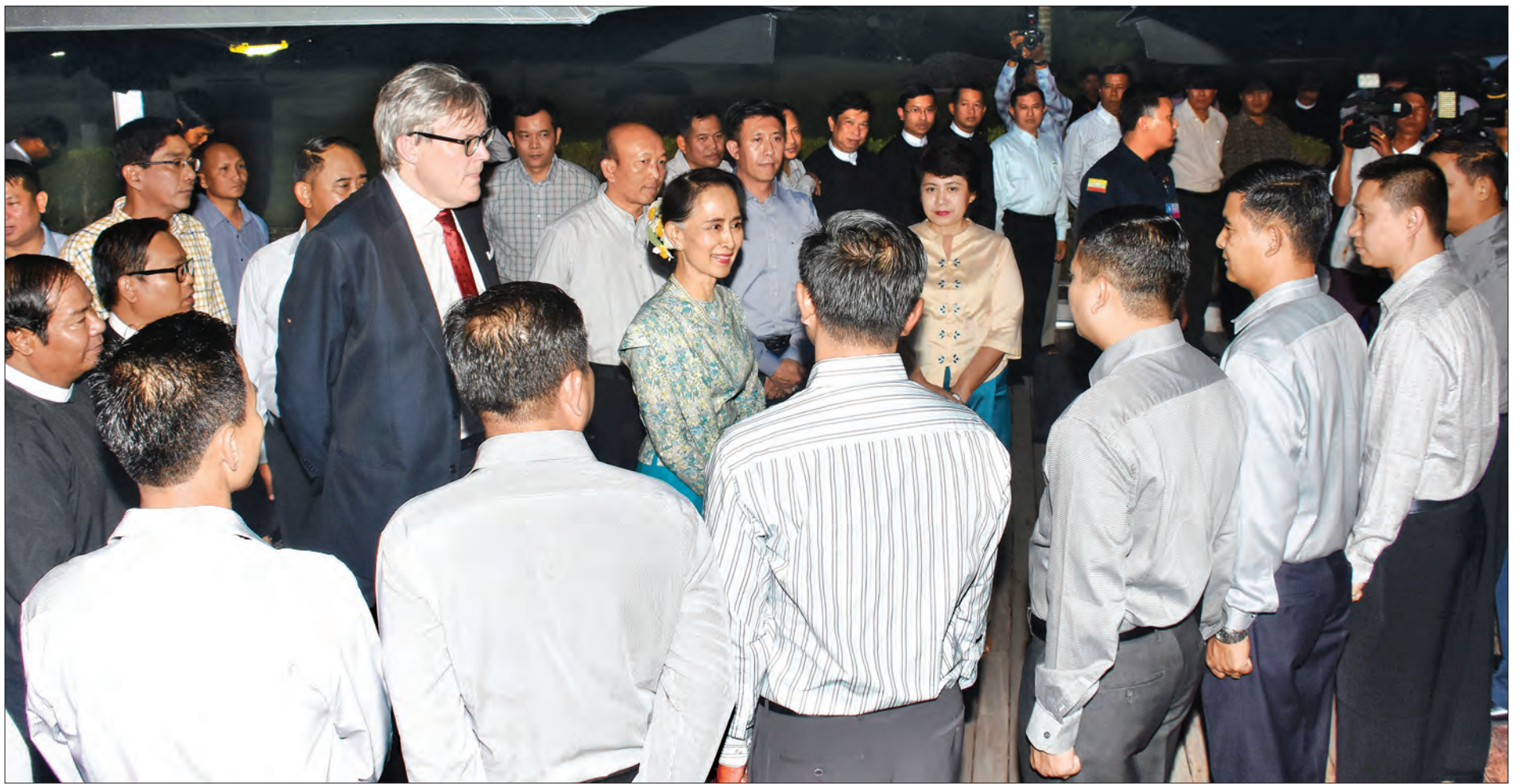
နိုင်ငံတော်၏အတိုင်ပင်ခံပုဂ္ဂိုလ် ဒေါ်အောင်ဆန်းစုကြည် ကာကွယ်ရေးကိုပိုမိုကျယ်ပြန့်သည့် လုံခြုံရေးအနေအထားအရ စီမံခန့်ခွဲခြင်းသင်တန်းမှ သင်တန်းနည်းပြများနှင့် သင်တန်းသားများ၏ ညစာစားပွဲအခမ်းအနားတွင် သင်တန်းသားများအား ရင်းရင်းနှီးနှီး နှုတ်ဆက်စဉ် (သတင်းစဉ်)

နေပြည်တော် မတ် ၉ နိုင်ငံတော်၏အတိုင်ပင်ခံပုဂ္ဂိုလ် ဒေါ်အောင်ဆန်းစုကြည်သည် ယနေ့ညနေပိုင်းတွင် ကာကွယ်ရေးကိုပိုမိုကျယ်ပြန့်သည့် လုံခြုံရေးအနေအထားအရ စီမံခန့်ခွဲခြင်းသင်တန်း (Management of Defence in the Wider Security Context)မှ သင်တန်းနည်းပြများနှင့် သင်တန်းသားများ၏ ညစာစားပွဲအခမ်းအနားသို့ တက်ရောက်သည်။