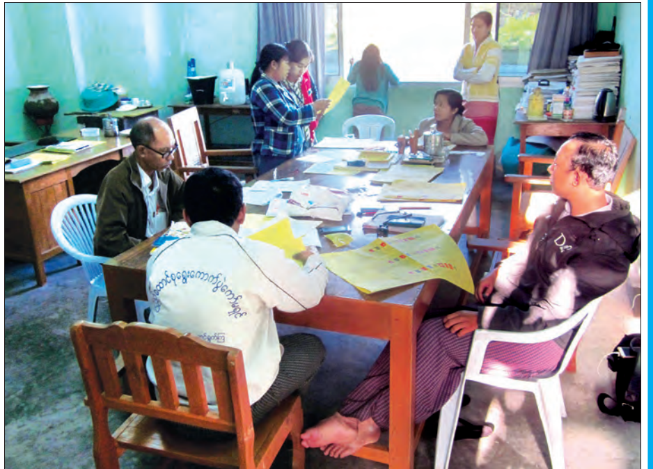
ရွေးကောက်ပွဲကာလအတွင်း မဲစာရင်းစာရွက်များပုံနှိပ်မှုကို စိစစ်ကြီးကြပ်နေစဉ်