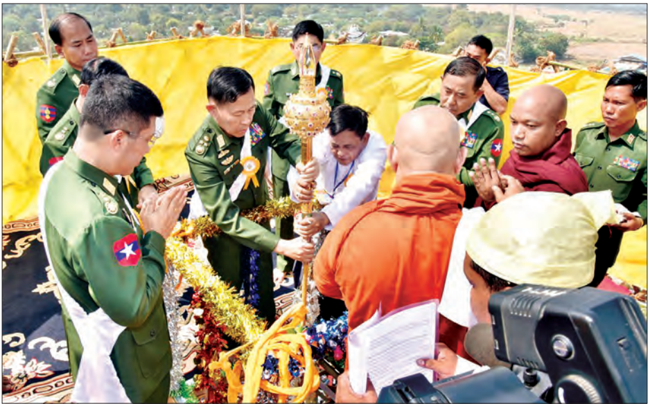
ဒုတိယတပ်မတော် ကာကွယ်ရေးဦးစီးချုပ် ကာကွယ်ရေးဦးစီးချုပ်(ကြည်း) ဒုတိယဗိုလ်ချုပ်မှူးကြီး စိုးဝင်း ရွှေယင်မျှော်စေတီတော်အထွတ်တွင် ရတနာစိန်ဖူးတော် တင်လှူပူဇော်စဉ်