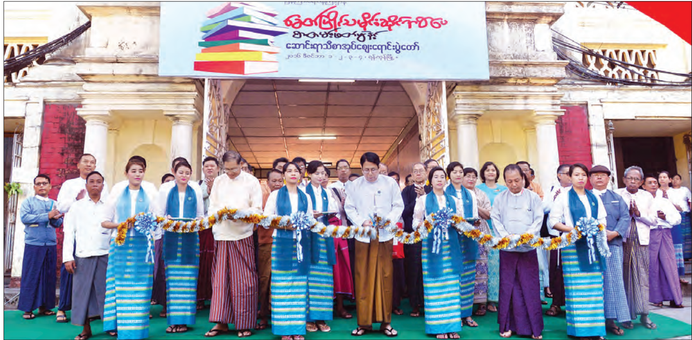
ပြည်ထောင်စုဝန်ကြီး ဒေါက်တာဖေမြင့် ခေတ်ပြိုင်သမိုင်းဆိုင်ရာစာပေ စာတမ်းဖတ်ပွဲနှင့် ဆောင်းရာသီစာအုပ်ဈေးရောင်းပွဲတော်ကို ဖဲကြိုးဖြတ် ဖွင့်လှစ်ပေးစဉ်

ပြန်ကြားရေးဝန်ကြီးဌာန ပုံနှိပ်ရေးနှင့် ထုတ်ဝေရေးဦးစီးဌာနသည် စာပေလုပ်ငန်းများ၊ နိုင်ငံတော်ပြန်တမ်းများ ပုံနှိပ်ထုတ်လုပ်ဖြန့်ချိခြင်း၊ ပညာရေးဝန်ကြီးဌာနမှ အပ်နှံသည့် အခြေခံပညာကျောင်းသုံးဖတ်စာအုပ်များ ပုံနှိပ်ပေးခြင်း၊ ပြည်ထောင်စုရွေးကောက်ပွဲကော်မရှင်ကအပ်နှံသည့် တစ်နိုင်ငံလုံးနှင့် သက်ဆိုင်သောဆန္ဒမဲလက်မှတ်များကို ရိုက်နှိပ်ပေးခြင်းများ အဓိကဆောင်ရွက်နေသည့်ဦးစီးဌာနတစ်ခုလည်း ဖြစ်သည်။