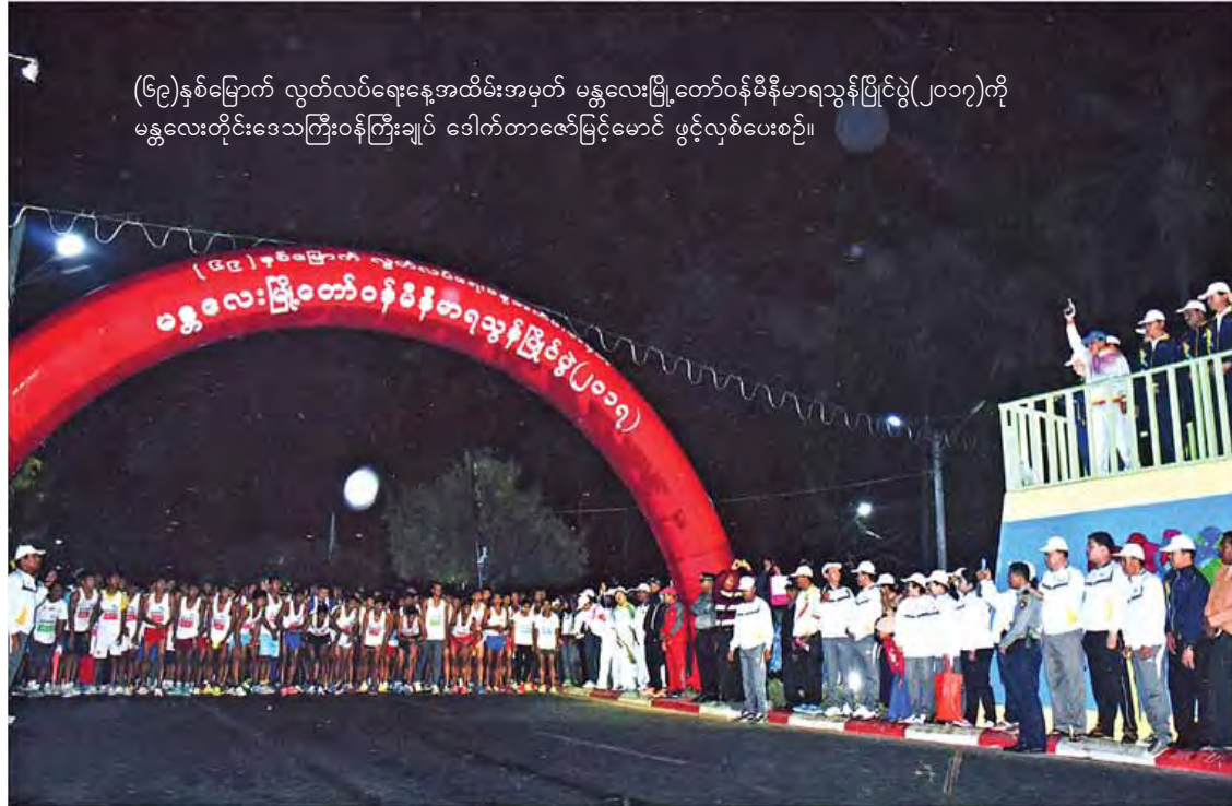
(၆၉)နှစ်မြောက် လွတ်လပ်ရေးနေ့အထိမ်းအမှတ် မန္တလေးမြို့တော်ဝန်မိနီမာရသွန်ပြင်ပွဲ(၂၀၁၇)ကို မန္တလေးတိုင်းဒေသကြီးဝန်ကြီးချုပ် ဒေါက်တာဇော်မြင့်မောင် ဖွင့်လှစ်ပေးစဉ်။

၂၀၁၆-၂၀၁၇ ဘဏ္ဍာနှစ်အတွင်း မန္တလေးတိုင်းဒေသကြီးမှာ ဆောက်လုပ်ဆဲ အိမ်ခန်းပေါင်း ၄၈၀ ရှိပြီး ဆောက်လုပ်ပြီး အိမ်ခန်းပေါင်း ၈၀၀ ကို ဝင်ငွေနည်းပြည်သူ့နဲ့ ဝန်ထမ်းတွေကို မဲနှိုက်ရောင်းချပေးခဲ့။ ပြည်ထောင်စုမှ အိမ်ခန်း ၂၄၀ နှင့် တိုင်းဒေသကြီးမှ အိမ်ခန်း ၅၆၀ အား နိုင်ငံ့ဝန်ထမ်းများ၊ အငြိမ်းစားဝန်ထမ်းများ၊ ကုမ္ပဏီဝန်ထမ်းများနှင့် ဝင်ငွေနည်းပြည်သူများသို့ ၂၀၁၇ ခုနှစ် ဇန်နဝါရီ ၄ ရက်တွင် ပွင့်လင်းမြင်သာစွာ မဲနှိုက်ရောင်းချပေးခဲ့။