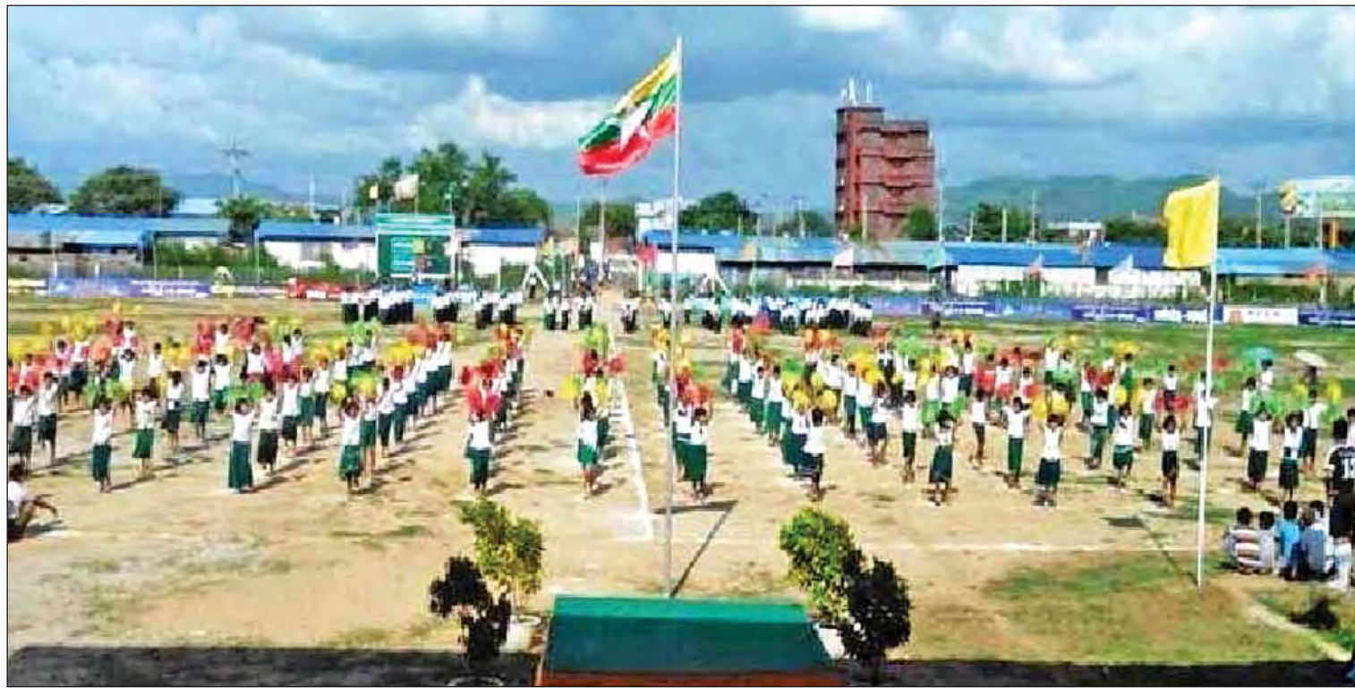
မန္တလေးတိုင်းဒေသကြီး စဉ့်ကိုင်မြို့နယ်တွင် မြို့နယ်အားကစားဖွံ့ဖြိုးတိုးတက်ရေးအစီအစဉ်အရ အားကစားပြိုင်ပွဲ ဖွင့်ပွဲအခမ်းအနားကျင်းပစဉ်။