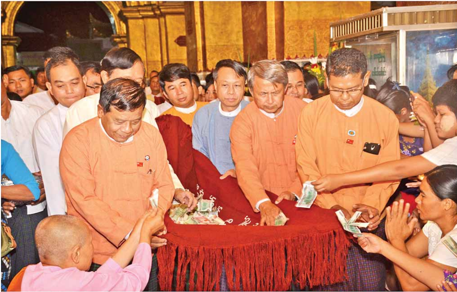
၂၀၁၆ ခုနှစ် ဒီဇင်ဘာ ၂ ရက်က စွယ်တော်မြတ်စေတီ(မန္တလေး)၌ ကျင်းပသည့် မသိုးသင်္ကန်းဆက်ကပ်လျှပ်စီးပွဲအခမ်းအနားတွင် သင်္ကန်းတော်အား လှည့်လည်ပူဇော်စဉ်။

မန္တလေးတိုင်း ဒေသကြီးအတွင်းရှိ တောင်သူ ၁၀၇၂၆၀ ၏ ဦးပိုင်မြေကေပေါင်း ၁၈၈၁၂၅ ဧကကို လယ်ယာမြေလုပ်ပိုင် ခွင့်ပြုလက်မှတ် ပုံစံ (၇) ထုတ်ပေးနိုင်ရေး ဆောင်ရွက် လျက်ရှိရာ တောင်သူ ၁၀၂၉၄၄၃ ဦး၏ ဦးပိုင်မြေ ပေါင်း ၁၇၉၁၇၆၆ ဧကကို လယ်ယာမြေလုပ်ပိုင်ခွင့်ပြု လက်မှတ် ပုံစံ (၇)ထုတ်ပေး နိုင်ခဲ့သဖြင့် ၉၄ ဒသမ ၉၀ ရာခိုင်နှုန်း ဆောင်ရွက် ပေးနိုင်ခဲ့