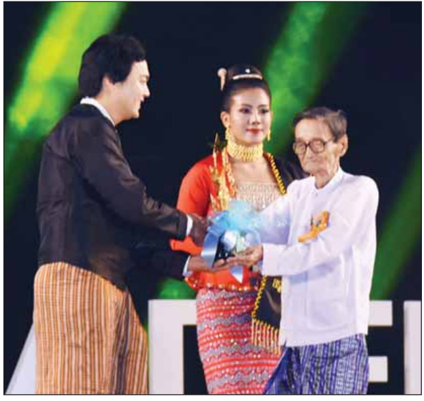
အကောင်းဆုံး ရုပ်ရှင်တေးဂီတဆုရှင် စိရာဇိုရီအား စည်သူဗိုလ်ကလေး တင်အောင်က အကယ်ဒမီရွှေစင်ရုပ် ချီးမြှင့်စဉ်။