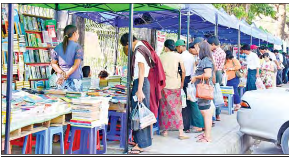
ရန်ကုန်မြို့၊ ဗိုလ်တထောင်မြို့နယ် သိမ်ဖြူလမ်းတွင် ဖွင့်လှစ်ရောင်းချလျက်ရှိသည့် စနေ-တနင်္ဂနွေ ရန်ကုန်စာအုပ်လမ်း စာအုပ်အရောင်းဆိုင်များ၌ စာပေချစ်မြတ်နိုးသူများ ကြည့်ရှုလေ့လာဝယ်ယူနေကြစဉ်။ (အတ်ပဲ-ဇော်မင်းလတ်)

ရန်ကုန် မတ် ၁၈ ရန်ကုန်မြို့၊ ဗိုလ်တထောင်မြို့နယ် သိမ်ဖြူလမ်း ဝန်ကြီးများရုံးရှေ့နှင့် ဗဟိုပုံနှိပ်စက်ရုံရှေ့တို့၌ အပတ်စဉ် စနေ-တနင်္ဂနွေနေ့တိုင်း ဖွင့်လှစ်သည့် ရန်ကုန်စာအုပ်လမ်း စာအုပ်ပေးအပ်ပွဲကို ယနေ့တွင် (၂၀)ရက်မြောက်နေ့အဖြစ် ဘာသာရပ်ဆိုင်ရာ စာအုပ်အဟောင်း/အသစ်မျိုးစုံ၊ မြန်မာမှုအနုလက်ရာဒီဇိုင်းပါ လွယ်အိတ်၊ ပိုက်ဆံအိတ်၊ အင်္ကျီများ၊ ရှားပါးငွေအကြွေများ၊ ငွေစက္ကူများ၊ မြန်မာမှု ကစားစရာအရပ်မျိုးစုံ စသည်တို့ကို ဆိုင်ခန်းဖွင့်ရောင်းချပေးကြရာ နံနက်ပိုင်းမှ ညနေပိုင်းထိ စာချစ်သူများဖြင့် စည်ကားခဲ့ကြောင်း သိရသည်။ (ကိုချစ်)