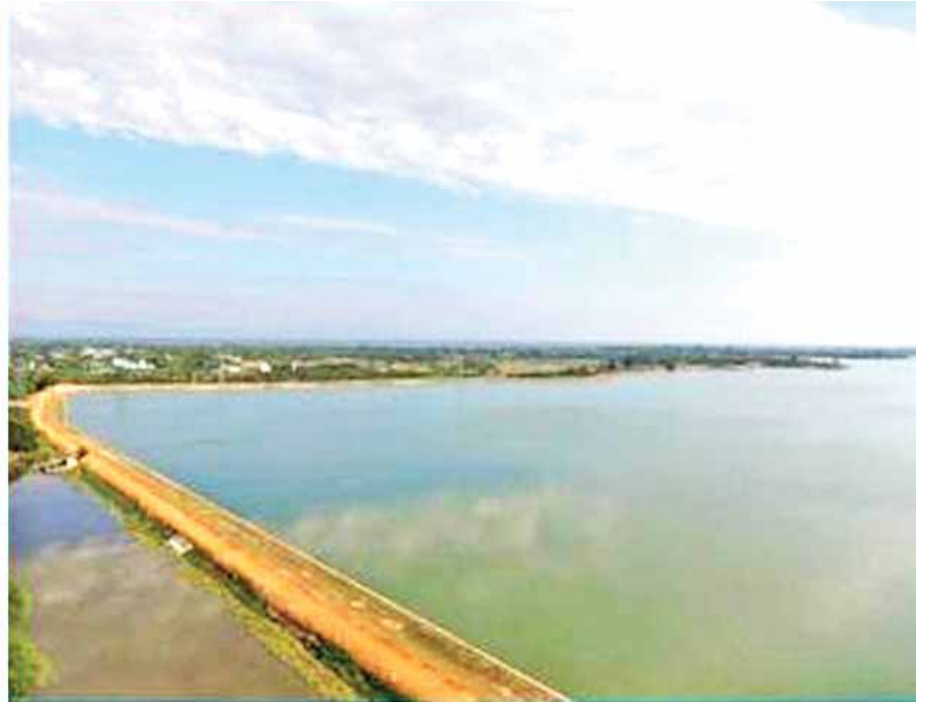
သာစည်မြို့နယ် ညောင်ရမ်း-မင်းလှကန် မပြုပြင်မီအခြေအနေ(ဝဲပုံ)နှင့် ပြန်လည်ပြုပြင်ပြီးတွေ့ရစဉ်။(ယာဝဲ)