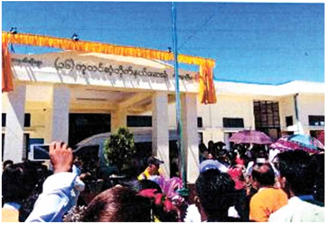
၂၀၁၆ ခုနှစ် ဇူလိုင် ၂၆ ရက်က အမရပူရမြို့နယ် (၁၆)တပုလင်ဆုံတိုက်နယ်ဆေးရုံဖွင့်ပွဲအခမ်းအနားကျင်းပစဉ်။