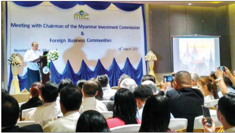
အမျိုးသားလုံခြုံရေးဆိုင်ရာအကြံပေးပုဂ္ဂိုလ် ဦးသောင်းထွန်း ရန်ကုန်မြို့ရှိ နိုင်ငံခြားစီးပွားရေးလုပ်ငန်းရှင်များနှင့် တွေ့ဆုံပွဲတွင် အမှာစကားပြောကြားစဉ်။

ကျောပိုးမှ ရှင်းလင်းပြတ်သားသော ရည်မှန်းချက်ထားရှိပြီးဖြစ်ကြောင်း၊ ယင်းမှာ ငြိမ်းချမ်းသာယာဝပြောသော ဒီမိုကရေစီနိုင်ငံတော် တည်ထောင်ရန်ဖြစ်ကြောင်း၊ ငြိမ်းချမ်းရေးလုပ်ငန်းစဉ်ကို ဦးစားပေးအဖြစ် သတ်မှတ်ဆောင်ရွက်နေပြီး တိုင်းရင်းသားလက်နက်ကိုင်များအားလုံးသို့ တွေ့ဆုံဆွေးနွေးရန် ကမ်းလှမ်းထားကြောင်း၊ တစ်ချိန်တည်းတွင် ကမ္ဘာ့သို့တံခါးဖွင့်လှစ်ပြီး နိုင်ငံတော်စီးပွားရေးကို ပြန်လည်တည်ဆောက်နေကြောင်း၊ အလုပ်အကိုင်၊ ပညာရေး၊ ကျန်းမာရေးစသည့် အခွင့်အလမ်းများ ဖန်တီးပေးလျက်ရှိကြောင်း၊ ပြည်သူ့အားလုံးအတွက် တရားမျှတသည့် လူ့အသိုက်အဝန်း တစ်ရပ် ပုံဖော်နိုင်ရေးအတွက် အစိုးရအုပ်ချုပ်မှုယန္တရားစနစ် ပြောင်းလဲဆန်းသစ်မှုများစတင်ခဲ့ကြောင်း ပြောကြားခဲ့သည်။