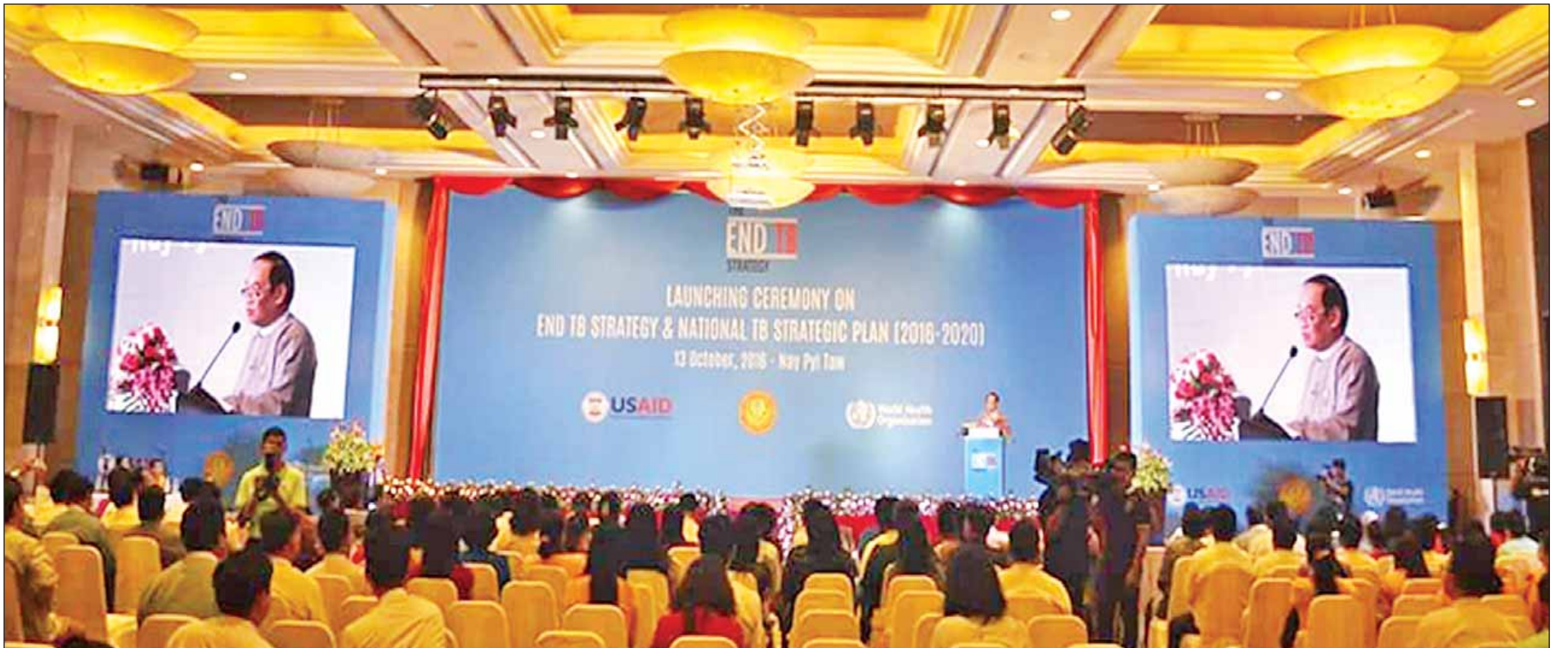
ကျန်းမာရေးနှင့် အားကစားဝန်ကြီးဌာန ပြည်ထောင်စုဝန်ကြီး ဒေါက်တာမြင့်ထွေး မြန်မာနိုင်ငံ တီဘီရောဂါတိုက်ဖျက်ရေးလုပ်ငန်း ငါးနှစ်စီမံချက်(၂၀၁၆-၂၀၂၀) နှင့်တီဘီရောဂါကင်းဝေးရေး နည်းဗျူဟာအသိပေးတင်ပြခြင်း အခမ်းအနားတွင် အမှာစကားပြောကြားစဉ်။

“ခုခံအားကျဆင်းမှုကူးစက်ရောဂါ လူနာ အထူးကဏ္ဍ (ခ) သို့ >>>