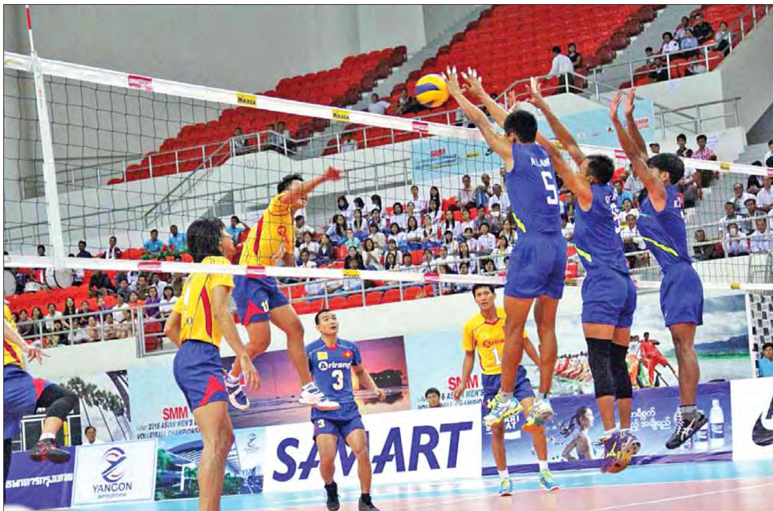
၂၀၁၆ ခုနှစ် ဩဂုတ်လကကျင်းပသည့် 2016 Asian Men's Club Volleyball Championship ပြိုင်ပွဲတွင် မြန်မာအသင်းနှင့် ဗီယက်နမ်အသင်းတို့ ယှဉ်ပြိုင်ကစားနေစဉ်။

တစ်နှစ်တာနီးပါးကာလအတွင်း အားကစားကဏ္ဍတွင်လည်း အားကစားမြေစိုက်ကိရိယာ (outdoor fitness equipment)များကို မြို့နယ် ၉၁ မြို့နယ်၊ ကျန်းမာရေးနှင့် အားကစား ဝန်ကြီးဌာနအောက်ရှိ တက္ကသိုလ် ၁၅ ခုနှင့် သူနာပြုနှင့် သားဖွား ကျောင်း ၅၀ သို့ ဖြန့်ဝေတပ်ဆင် ပေးခဲ့ကြောင်း၊ Township Sports Development Program (TSDP) အစီအစဉ်အရ စုစုပေါင်း ၁၅၁ မြို့နယ်တွင် အားကစား နည်းမျိုးစုံပါဝင်သည့် အားကစား ပြိုင်ပွဲများ စည်ကားသိုက်မြိုက်စွာ ကျင်းပခဲ့