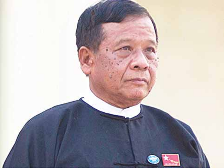
မန္တလေးတိုင်းဒေသကြီးဝန်ကြီးချုပ် ဒေါက်တာတော်မြင့်မောင်။

မန္တလေးမြို့တော် စည်ပင်သာယာရေး နယ်နိမိတ်အတွင်းရှိ မြို့နယ် ခြောက်မြို့နယ် ဖွံ့ဖြိုးတိုးတက်ရေးအတွက် နိုင်ငံ့ကဏ္ဍရာ လမ်း ၁၀မိုင်ကျော်၊ ကတ္တရာလမ်း မိုင် ၅၀ ကျော်၊ ကျောက်ချောလမ်း ငါးမိုင်ကျော်၊ ကွန်ကရစ်လမ်း တစ်မိုင်ကျော်၊ တံတား ၂၃၁ စင်း တည်ဆောက်ဖောက်လုပ်ခြင်း၊ အဆင့် မြင့် မီးပိုင်း ၁၀ ပိုင်းတပ်ဆင်ခြင်း၊ ကျုံး ပတ်လည်လျှောက်လမ်း၌ LED လမ်းမီး ၁၀၀၀ ကျော်တပ်ဆင်ခြင်း၊ အငှားအိမ်ရာ နှစ်လုံး အခန်းပေါင်း ၁၄၄ ခန်း ဆောက်လုပ် ခြင်း၊ ယောမင်းကြီးဈေး၊ ယာယီမင်္ဂလာဈေး တည်ဆောက်ခြင်း၊ ခေတ်မီသားသတ်ရုံ တည်ဆောက်ခြင်း၊ သခင်ဖိုးလှကြီးအားကစား ကွင်း၊ အောင်ပင်လယ်အားကစားကွင်း၊ မြရည်