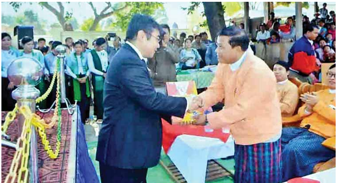
၂၀၁၇ ခုနှစ် ဇန်နဝါရီ ၁၅ ရက်က မတ္တရာမြို့နယ် ရေနံ့သာကျေးရွာ မူလတန်းလွန်ကျောင်း ကျောင်းဆောင်သစ်အဆောက်အအုံအား ဂျပန်သံရုံးပထမအတွင်းဝန်က မန္တလေးတိုင်းဒေသကြီး ဝန်ကြီးချုပ် ဒေါက်တာဇော်မြင့်မောင်ထံ လွှဲပြောင်းပေးအပ်စဉ်။

ပုဂ္ဂလိက ဓာတ်အားဖြန့်ဖြူးရေး ရှစ်ခုတို့မှ ၁၁ ကေပို့ဓာတ်အားလိုင်း ၇၂ မိုင်၊ ၄၀၀ ဗို့အထူးကဏ္ဍ (ဆ) သို့ »