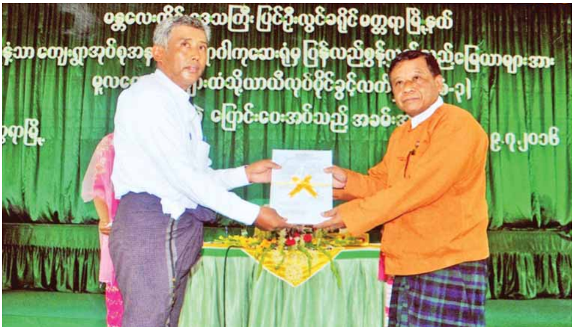
မန္တလေးတိုင်းဒေသကြီး ဝန်ကြီးချုပ် ဒေါက်တာဇော်မြင့်မောင် ပြန်လည်စွန့်လွှတ်မြေများအား မူလတောင်သူများထံသို့ ယာယီလုပ်ပိုင်ခွင့်လက်မှတ် ပြန်လည်လွှဲပြောင်းပေးအပ်သည့်အခမ်းအနားတွင် ယာယီလုပ်ပိုင်ခွင့်လက်မှတ်လွှဲပြောင်းပေးအပ်စဉ်။