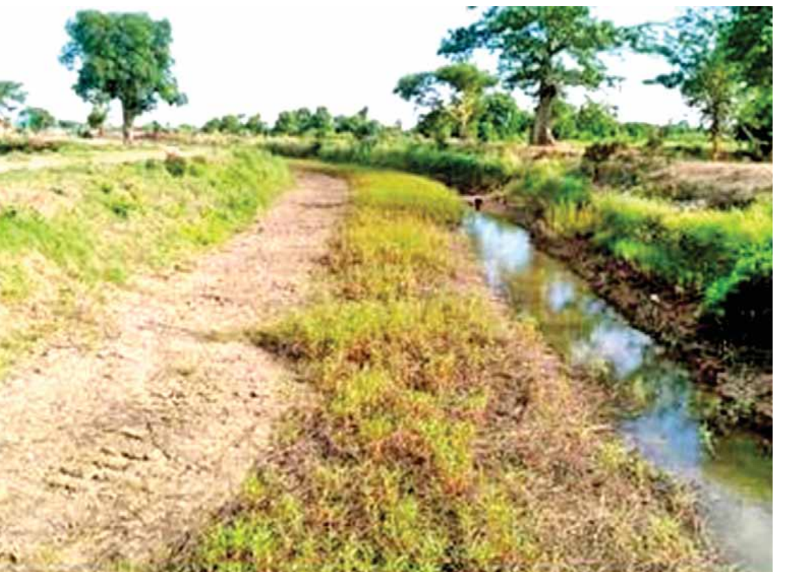
မြစ်သားမြို့နယ် ပန်းလောင်ရေသောက်စနစ်ရှိ စမာဒုတိယမြောင်း ၆ ဒသမ ၄ မိုင်ကို မြောင်းပုံစံကျတူးဖော်ခြင်းလုပ်ငန်း မဆောင်ရွက်မီ(အပေါ်ပုံ)နှင့် ဆောင်ရွက်ပြီးအခြေအနေကို တွေ့ရစဉ်။ (အောက်ပုံ)

မန္တလေးတိုင်းဒေသကြီး အစိုးရအဖွဲ့အနေ ဖြင့် ရှေ့ဆက်လက်၍ တိုင်းဒေသကြီး ဖွံ့ဖြိုး တိုးတက်ရေးအတွက် အင်တိုက်အားတိုက် ကြိုးပမ်းဆောင်ရွက်သွားမည်ဟု သန္နိဋ္ဌာန်ချ ထားသည်ဟု သိရှိရပါကြောင်း ရေးသားတင်ပြ လိုက်ရပါသည်။ ။