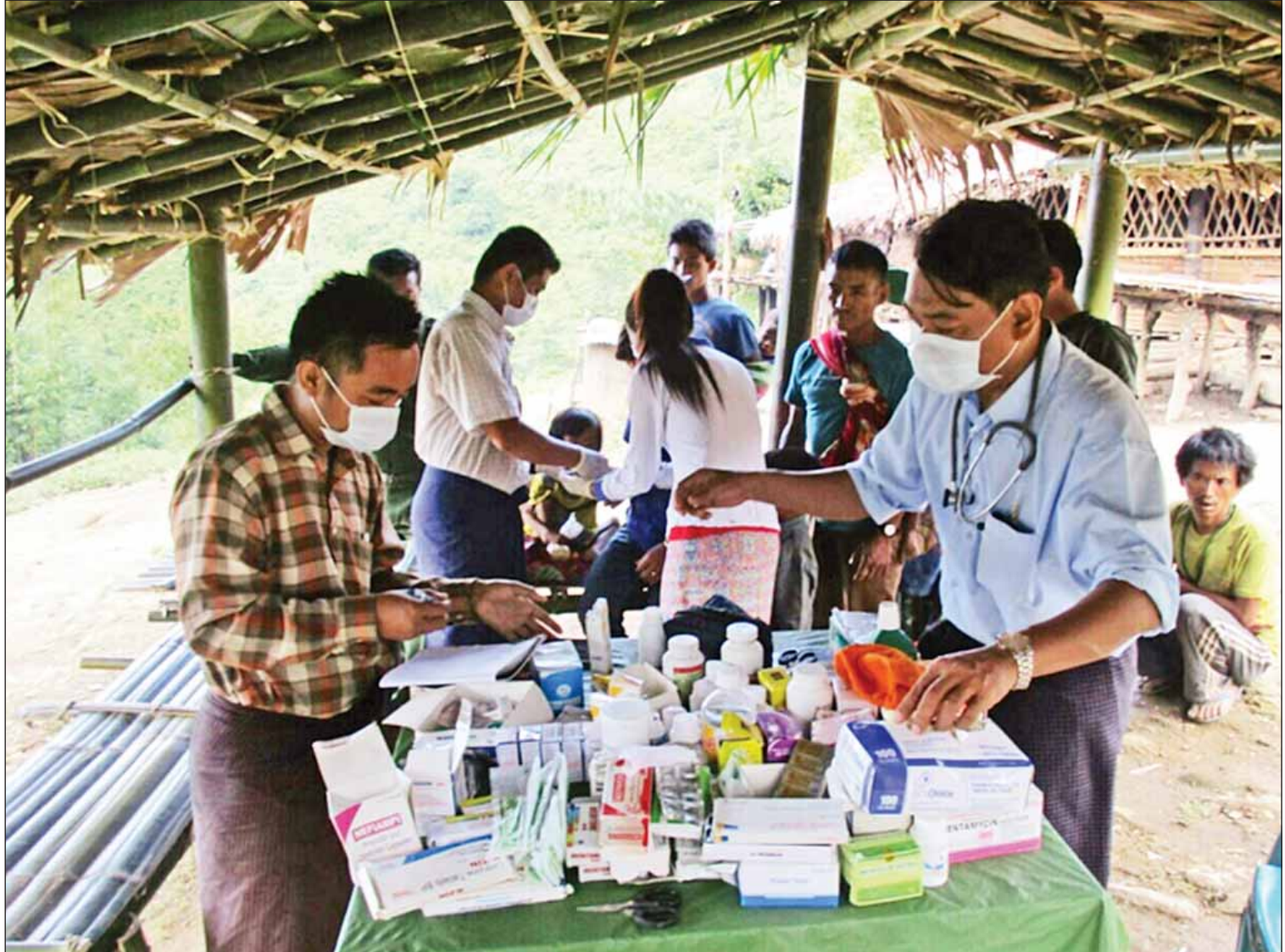
၂၀၁၆ ခုနှစ် ဩဂုတ်လက စစ်ကိုင်းတိုင်းဒေသကြီး လဟယ်မြို့နယ်နှင့် နန်းယွန်းမြို့နယ်တို့တွင်ဖြစ်ပွားခဲ့သော ဝက်သက်ရောဂါဖြစ်ပွားမှုကြောင့် လူအများသေဆုံးမှုဖြစ်ပွားသဖြင့် အဆိုပါဒေသများအထိအရောက်သွားကာ ဒေသခံများအား ကျန်းမာရေးစောင့်ရှောက်မှုပေးနေစဉ်။

တည်ဆောက်ပေးခဲ့သလို တစ်နိုင်ငံလုံး ကျန်းမာရေးစောင့်ရှောက်မှု လွှမ်းခြုံနိုင်ရန် နိုင်ငံတကာအစိုးရမဟုတ်သော အဖွဲ့အစည်းပေါင်း ၅၀ ကျော်နှင့်ပူးပေါင်း၍လည်း ကျန်းမာရေးဝန်ဆောင်မှုများပေးနေကြောင်း၊ GAVI HSS ၏ ပံ့ပိုးမှုဖြင့် နွမ်းပါးအမျိုးသမီးလူနာနှင့် အသက် ငါးနှစ်အောက်ကလေး ၃၅၈၁၂ ဦးကို ခရီးစရိတ်၊ နေ့တွက်စရိတ်၊ ဆေးဖိုးကုန်ကျငွေ စုစုပေါင်းကျပ်သန်း ၁၆၆၁ ဒသမ အထူးကဏ္ဍ (ဂ) သို့ >>>