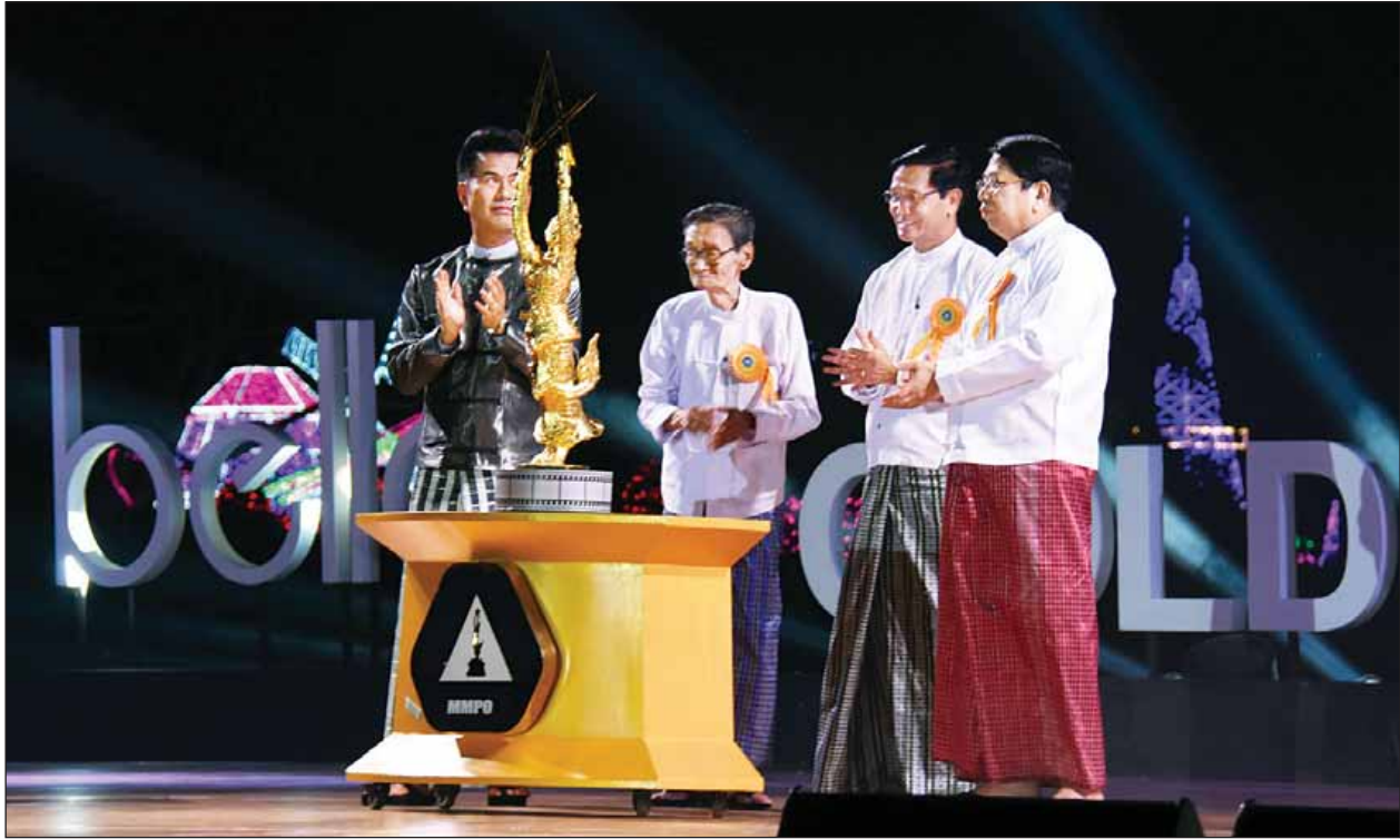
ချီးမြှင့်ဂုဏ်ပြုမယ့် အခမ်းအနားဖြစ်ပါတယ်။ ရုပ်ရှင်ထူးချွန်ဆုတွေ ရွေးချယ်ချီးမြှင့်ခြင်းကို ၂၀၁၃ ခုနှစ်မှစပြီး မြန်မာနိုင်ငံရုပ်ရှင်အစည်းအရုံးက တာဝန်ယူဆောင်ရွက်ခဲ့တာ ဖြစ်ပါတယ်။ ပြန်ကြားရေးဝန်ကြီးဌာနအနေနဲ့ကတော့ လိုအပ်တဲ့ကဏ္ဍတွေမှာ ကူညီဆောင်ရွက်ပေးလျက် ရှိပါတယ်။ ဒါ့အပြင် နောင်ကို မြန်မာ့ရုပ်ရှင်လောကဖွံ့ဖြိုးတိုးတက်ရေးအတွက် အဘက်ဘက်က ပံ့ပိုးကူညီသွားမယ့်အကြောင်း အစီရင်ခံလိုပါတယ်။” “ရုပ်ရှင်လောကသားတွေ စုံလင်စွာတက်ရောက်ခဲ့တဲ့ ဒီကနေ့ အခမ်း

ဆက်လက်၍ ပြန်ကြားရေးဝန်ကြီးဌာန ပြည်ထောင်စုဝန်ကြီး ဒေါက်တာဖေမြင့်က အဖွင့်အမှာစကားပြောကြားရာတွင် “ဒီကနေ့ဟာ ပြီးခဲ့တဲ့ ၂၀၁၆ ခုနှစ်အတွင်း ရုံတင်ပြသခဲ့တဲ့ မြန်မာ့ရုပ်ရှင်ကား ၃၃ ကားထဲမှ အထူးခြားဆုံးရုပ်ရှင်၊ အထူးချွန်ဆုံးသရုပ်ဆောင်ခဲ့တဲ့ အနုပညာရှင်တွေ၊ အပြောင်ပြောက်ဆုံးဖန်တီးခဲ့တဲ့ အတတ်ပညာရှင်တွေနဲ့ အကောင်းဆုံးစီစဉ် ထုတ်လုပ်သူတွေကို