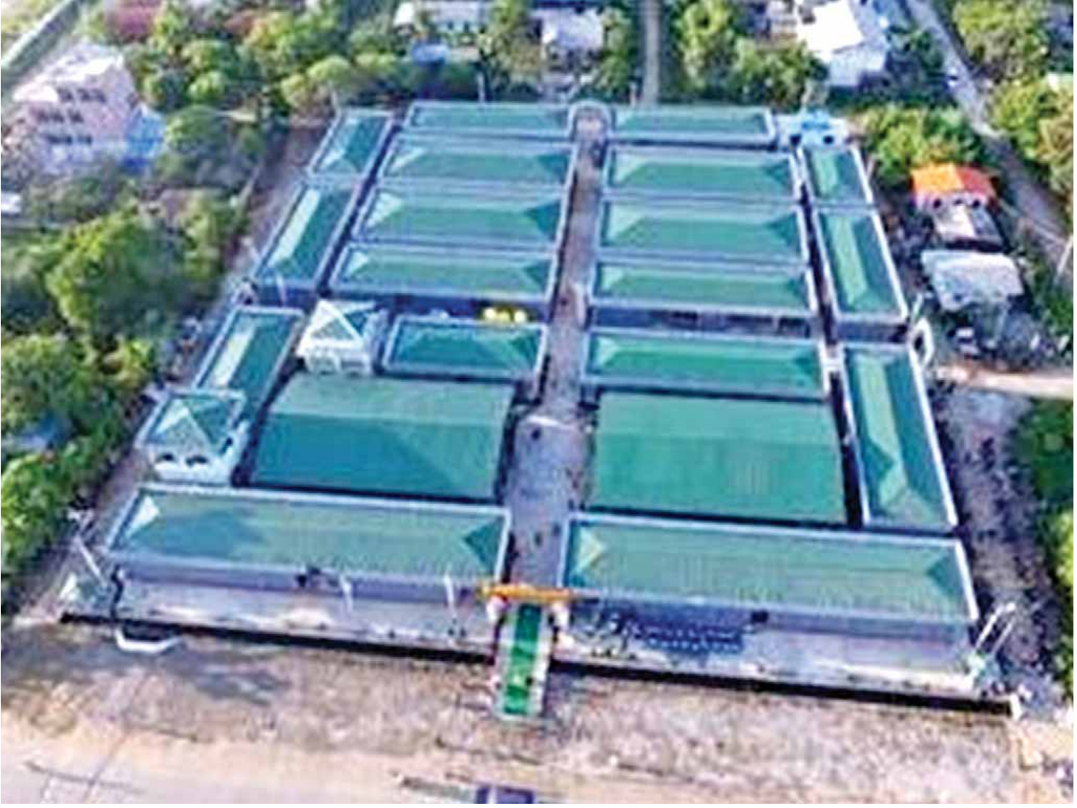
မန္တလေးတိုင်းဒေသကြီးစည်ပင်သာယာရေးအဖွဲ့က ၂၀၁၆-၂၀၁၇ ဘဏ္ဍာနှစ်တွင် ဖွင့်လှစ်ခဲ့သော ပုသိမ်ကြီး မြို့မဈေး။ အထူးကဏ္ဍ (၈) သို့ >>>

မန္တလေးတိုင်းဒေသကြီး ကျေးလက်ဒေသ ဖွံ့ဖြိုးတိုးတက်ရေးဦးစီးဌာနအနေဖြင့် ၂၀၁၆-၂၀၁၇ ဘဏ္ဍာနှစ် ပြည်ထောင်စုဘတ်ဂျက် ဖြင့် လမ်းများဖောက်လုပ်ခြင်း၊ တံတားများ