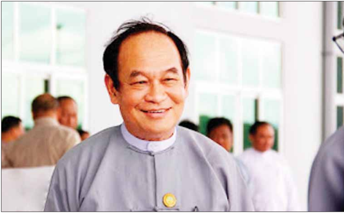
ကျန်းမာရေးနှင့် အားကစားဝန်ကြီးဌာန ပြည်ထောင်စုဝန်ကြီး ဒေါက်တာမြင့်ထွေး။

လက်ရှိ ကျန်းမာရေးနှင့်အားကစားဝန်ကြီးဌာနအောက်တွင် ဆေးရုံပေါင်း ၁၁၂၃ ရုံ၊