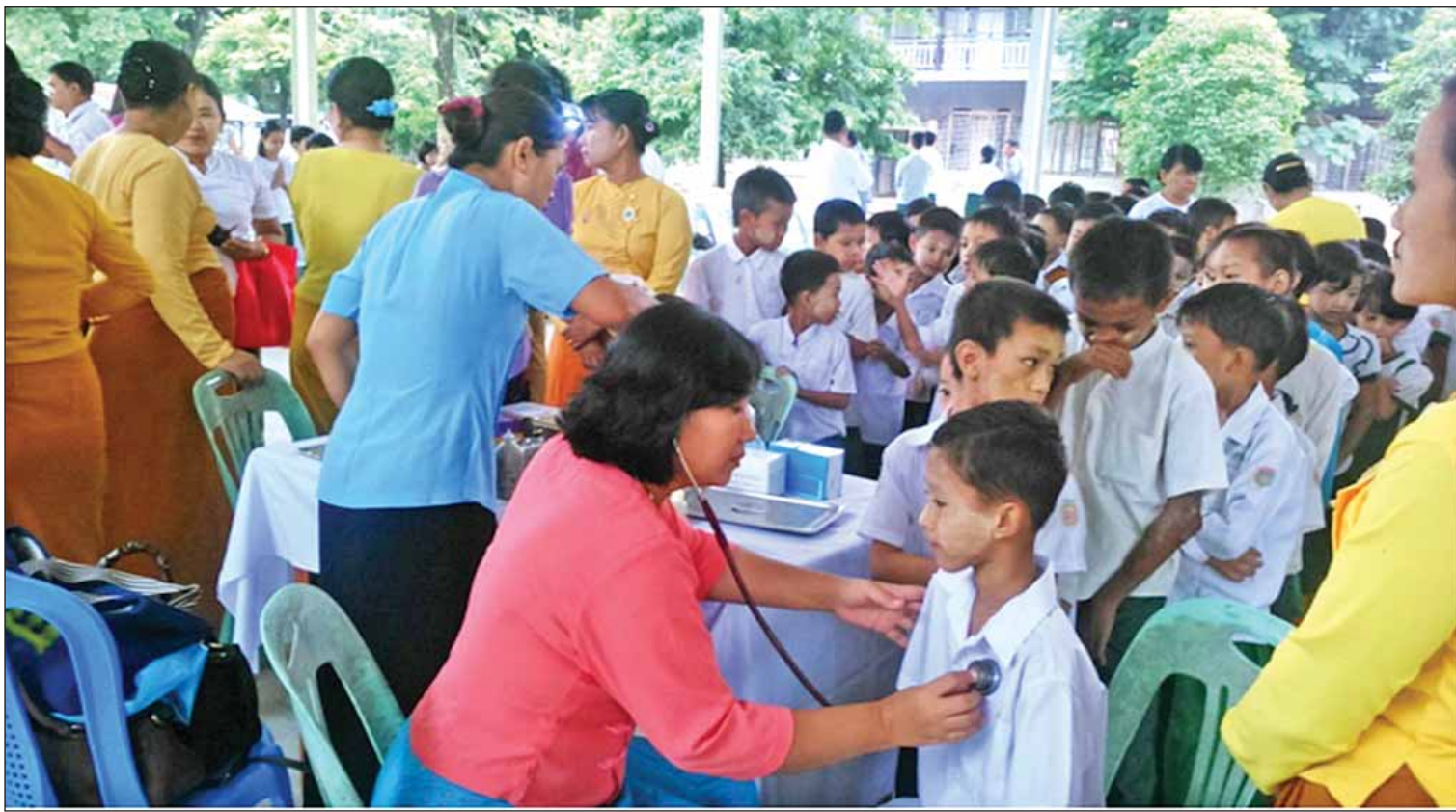
၂၀၁၆ ခုနှစ် ဩဂုတ်လ ကျောင်းကျန်းမာရေးသီတင်းပတ်လှုပ်ရှားမှုအဖြစ် ကျောင်းသားကျောင်းသူများအား ကျန်းမာရေးစောင့်ရှောက်မှုများ ဆောင်ရွက်ပေးစဉ်။

ပြည်သူများ တီဘီရောဂါ ရှာဖွေရာ၌ သိပ္ပံနည်းကျ တိကျစွာဖော်ထုတ်သတ်မှတ်နိုင်ရန် အတွက် အမေရိကန်ဒေါ်လာ ၁ ဒသမ ၂ သန်းတန်ဖိုးရှိ ဇီဝလုံခြုံမှု အဆင့်(၃) (Biosafety III Laboratory) ဓာတ်ခွဲခန်းကို ရန်ကုန်မြို့၊ မန္တလေးနှင့် တောင်ကြီး မြို့တို့တွင် တည်ဆောက်ထားရှိကြောင်း၊ ရှေးဦးကုသရေးလုပ်ငန်းများ၊ မကူးစက်နိုင်သောရောဂါများ (ဆီးချို၊ သွေးချို၊ သွေးတိုး၊ သက်ကြီးရွယ်အိုနှင့် ကျန်းမာရေးပညာပေးခြင်း)နှင့် ပတ်သက်၍ စောင့်ရှောက်ပေးခြင်း လုပ်ငန်းများကို ကျေးရွာများအထိ ပိုမိုအထူးပြု ဆောင်ရွက်ပေးလျက်ရှိ