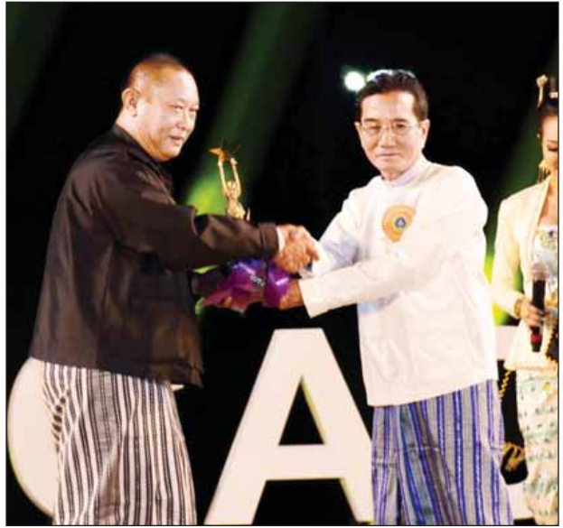
အကောင်းဆုံး ရုပ်ရှင်အသံဆုရှင် ဦးကြည်မင်းသိန်းအား ပန်းချီစိုးမိုးက အကယ်ဒမီရွှေစင်ရုပ် ချီးမြှင့်စဉ်။