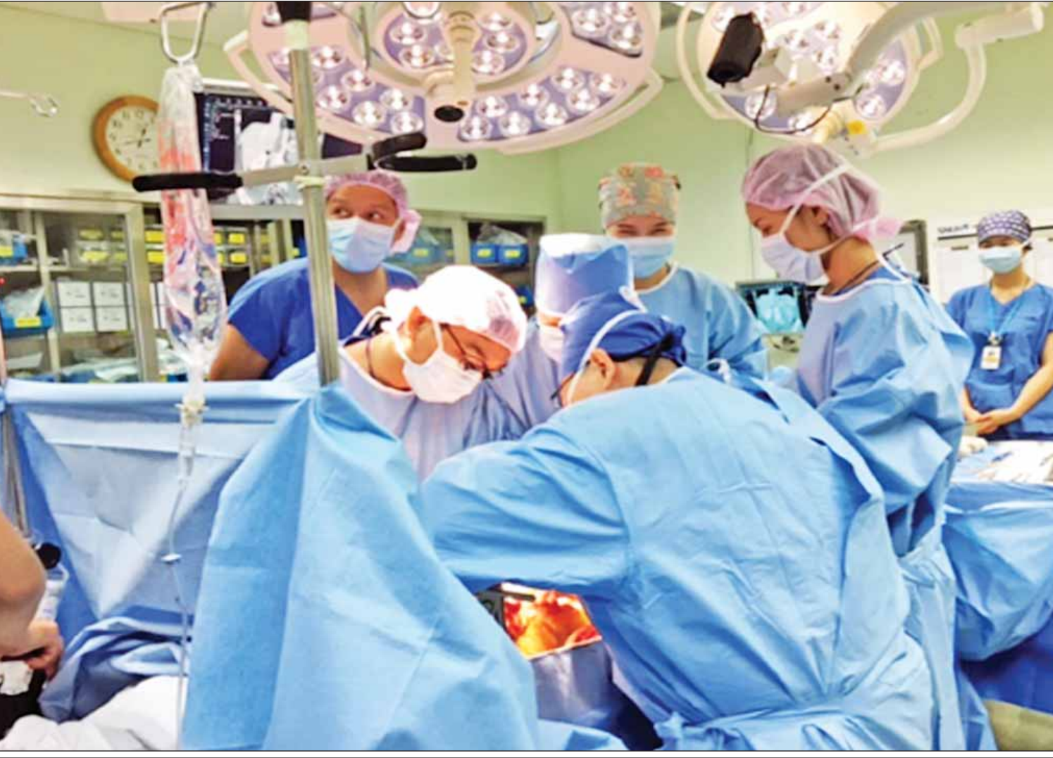
ကျန်းမာရေးကဏ္ဍ အဆင့်မြှင့်တင်မှုအနေဖြင့် အသည်းအစားထိုးကုသမှုများကိုလည်း ဆောင်ရွက်လာနိုင်ပြီဖြစ်သည်။

အရည်အသွေးပြည့်ဝသည့် တိုင်းရင်းဆေးဝန်ဆောင်မှု တိုင်းရင်းဆေးကဏ္ဍတွင်လည်း ပြည်သူများ အရည်အသွေးပြည့်ဝသည့် တိုင်းရင်းဆေးဝန်ဆောင်မှုပေးနိုင်ရန် တိုင်းရင်းဆေးရုံများတွင် စဉ်ဆက်မပြတ်ပညာပေး သင်တန်းပေါင်းများစွာ ပို့ချဆွေးနွေးခြင်း၊ တိုင်းရင်းဆေးဆရာ ၃၅၀၀ ခန့်ကို အကြောင်းအရာခေါင်းစဉ် ကိုးခုဖြင့် ကုထုံးကုနည်းများ၊ SOP များထွက်ရန် သင်တန်းပေးဆွေးနွေးခြင်းတို့ကို ဆောင်ရွက်ခဲ့ပြီး သုတေသနလုပ်ငန်းကျွမ်းကျင်မှုကို မြှင့်တင်ရန် တိုင်းရင်းဆေးပညာဦးစီးဌာနနှင့် နိုင်ငံခြားတက္ကသိုလ် ၃၀ တို့ ပေါင်းစပ်လုပ်ကိုင်နေသည်ဟု ဆိုသည်။