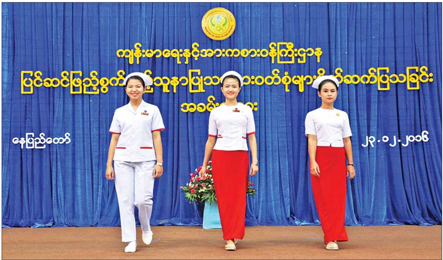
ကျန်းမာရေးနှင့် အားကစားဝန်ကြီးဌာနမှ သူနာပြုများ နိုင်ငံတကာအဆင့်မီတာဝန်ထမ်းဆောင်နိုင်ရန် ပြင်ဆင်ဖြည့်စွက်မည့် သူနာပြုသားဖွားဝတ်စုံများမိတ်ဆက်ပြသနေစဉ်။

ဆရာဝန်များ အရည်အသွေးမြင့်လာစေရန် အတွက် နိုင်ငံခြားတက္ကသိုလ် ၁၀၂ ခုနှင့်ပူးပေါင်း၍ ကျွမ်းကျင်မှုမြှင့်တင်ရေးသင်တန်းများ၊ ပူးပေါင်းခွဲစိတ်ခြင်းလုပ်ငန်းများကို အရှိန်မြှင့်ဆောင်ရွက်ခြင်း၊ ပြည်သူများကို အထူးကုဆရာဝန်များအနေဖြင့် ကျန်းမာရေးဝန်ဆောင်မှုပေးနိုင်ရန် ဘွဲ့လွန်သင်တန်းသို့ ဆရာဝန် ၁၅၆၅ ဦး တက်ရောက်စေခြင်း စသည့် လုပ်ငန်းများကိုလည်း ဆောင်ရွက်နိုင်ခဲ့