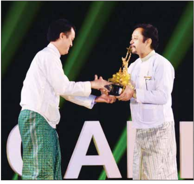
အကောင်းဆုံး ရုပ်ရှင်တည်းဖြတ်ဆုရှင် ဉာဏ်ဝင့်အား ဦးဇော်မင်း (ဟံသာမြေ)က အကယ်ဒမီရွှေစင်ရုပ် ချီးမြှင့်စဉ်။